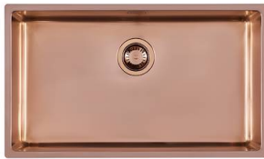
Spülbecken KE Copper 2157 858